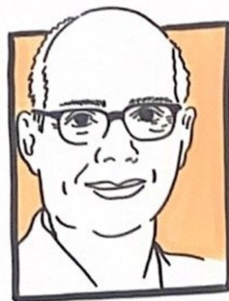
OMAR M. YAGHI